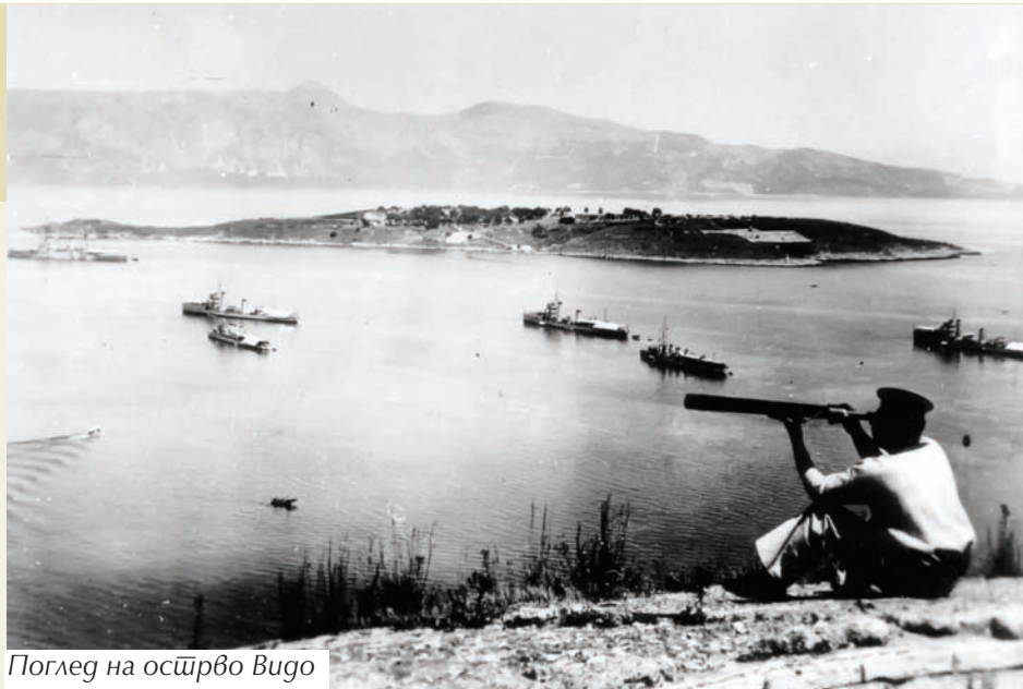
Поглед на острво Видо