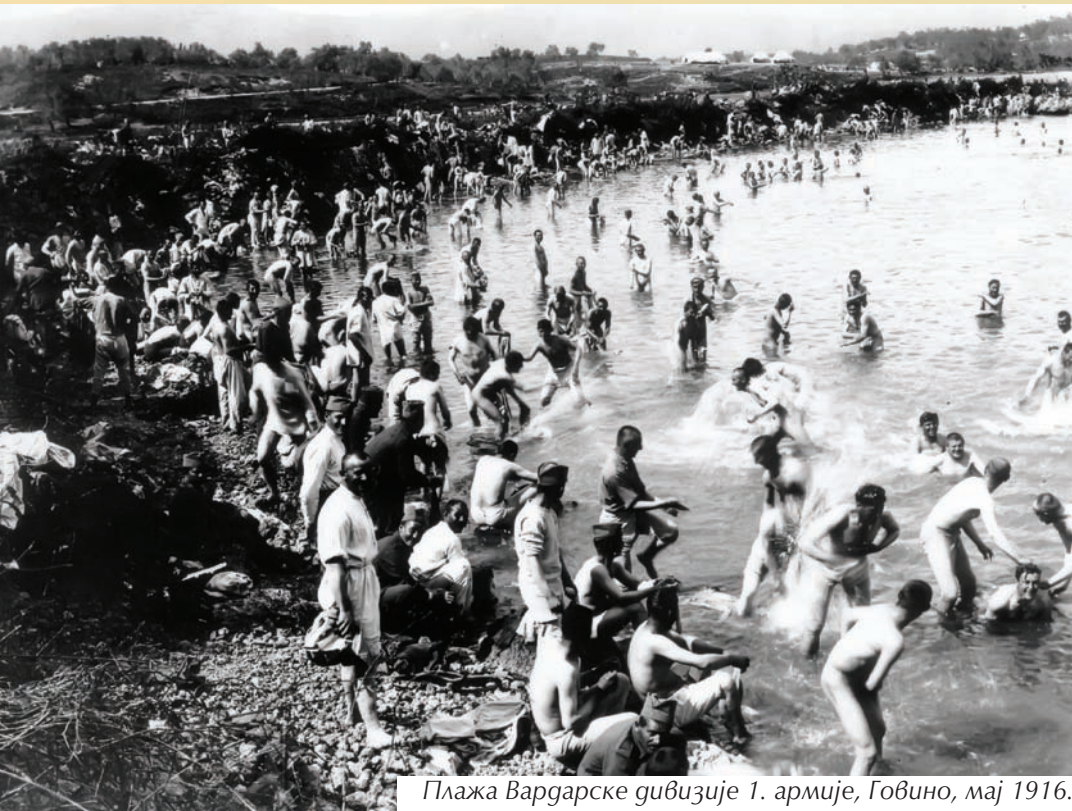
Плажа Вардарске дивизије 1. армије, Говино, мај 1916.

цуском мисијом постигнут је договор да уколико се овако ограничен логор покаже као недовољан, да се може заузети и полуострво Фустапидама, али под условом да се српске трупе распоређују источно од пута и да се логор не шири у долину Стравопотомаса. У логору Доњи Ипсос била је смештена Тимочка војска и трупе Нових области. Граница логора била је: на истоку – море; јужно – река Стравопотомас; западно – гребенска линија између два пута, од Говина за Ипсос и за Коракану; северно – линија склопа који излази на море близу Шмркова. Логор Доњи Ипсос могао је да се шири једино ка западу. Логор Горњи Ипсос био је додељен Шумадијској дивизији првог позива, Шумадијској дивизији другог позива, Тимочкој дивизији првог позива, Тимочкој дивизији другог позива. Земљиште северно од замка Бомбели, са обе стране пута од Ипсоса за Коракану, према западу није било ограничено линијом и српске трупе могле су да се несметано размештају у том правцу. Са француском мисијом постигнут је договор о заузимању природних тераса западно од села Ипсоса, уколико то буде потребно. Врховна команда указала је командантима на опасност размештаја на мочварном земљишту поред мора. Након споразума са француском мисијом о размештају српских трупа, наставила је да ради српска комисија задужена за формирање нових логора на југу острва Крф.