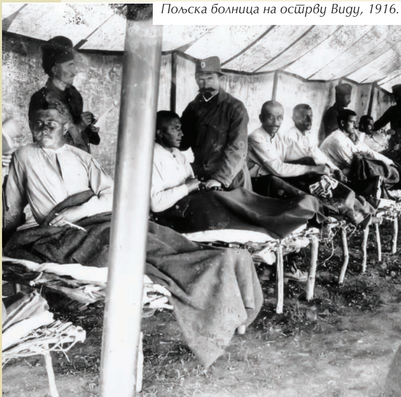
Пољска болница на острву Виду, 1916.

Ради што бољег лечења најтежи болесници изоловани су на острво Видо, које је у успоменама очевидаца остало упамћено као „острво смрти“. Крајем јануара на Виду су устројене болнице, али у њима није било најосновније опреме. Француска мисија је 6. фебруара примила 25 барака за склапање амбуланти које је требало изградити у логорима на Виду и Лазарету. Њихово подизање ишло је доста споро, јер је претходно требало нивелисати терен, с обзиром на то да је под баракама био од дасака. На основу утврђеног плана, за једну бараку био је потребан један и по дан за склапање. Велику помоћ у опремању болница пружио је енглески Црвени крст. На основу наређења Врховне команде од 12. фебруара, истог дана од људства Тимочке војске формирана је чета јачине 250 и упућена на радове