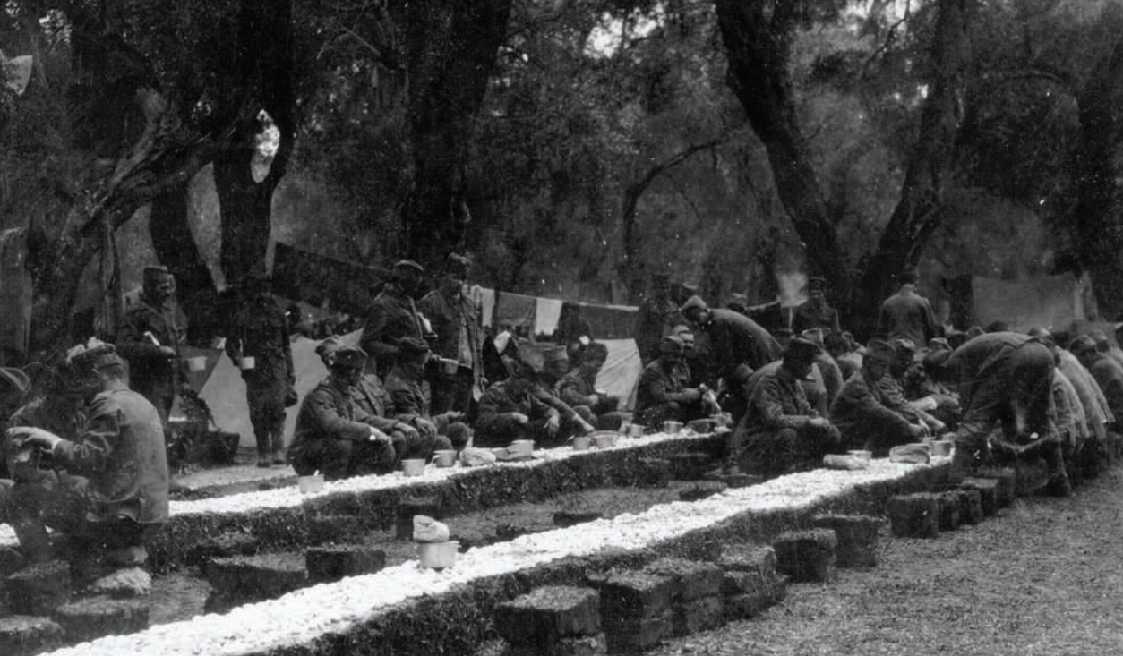
Пољска шпрезарија 4. пешадијског пука „Шеван Немања“ Дринске дивизије, Говино, фебруар 1916.

Снабдевање храном функционисало је тако што је српска интендатура требовала одређену количину хране, преузимала је од француске интендатуре и делила војницима по логорима. Француска мисија тражила је да се српски официри читко потписују на требовањима како би се знало коме је потребно испоручити требовани материјал. Тако је настао проблем са једним српским апотекарском који се нечитко потписао и било је проблема око испоруке поручених лекова и креча. С обзиром на то да српска војска у почетку није располагала превозним средствима, храна су морем превозили француски бро-