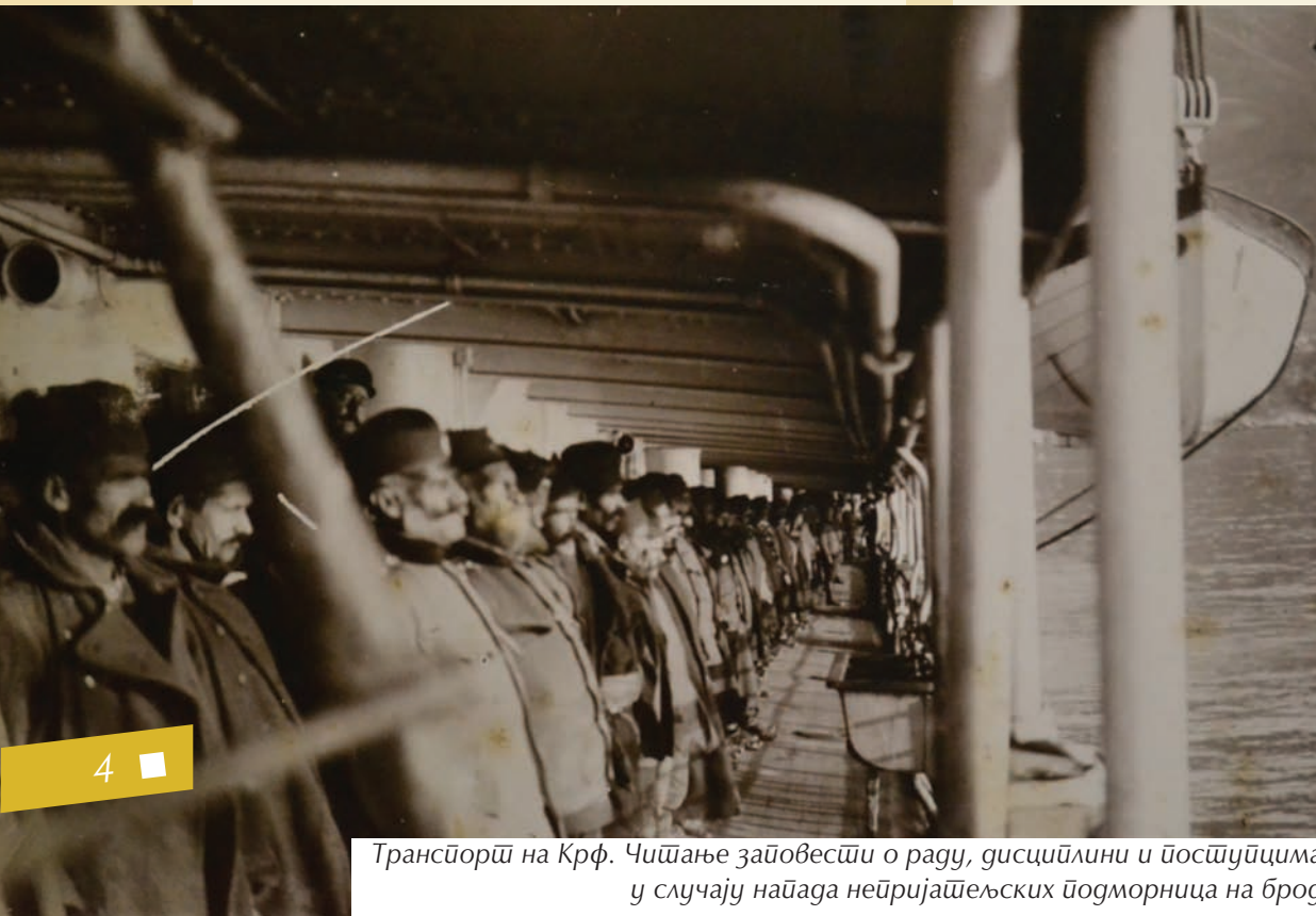
Транспорти на Крфу. Чишћење зајовессти о раду, дисциплини и постојцима у случају најада нейријашељских подморница на брод

Као пример наводимо путовање команданта Друге армије војводе Степе Степановића, који се са једним делом армијског штаба 31. јануара у 18 часова укрцао у Драчу на француски брод „Армениа“. Брод је из Драча кренуо 1. фебруара у 1 час и стигао у Валону у 8 часова. Одатле се војвода Степановић са штабом укрцао на италијански брод „Ре Виторио“ и на њој остао у истом пристаништу све до 2. фебруара после поноћи, када је лађа кренула за Крф и стигла у 10 часова у пристаниште Говино. Други део штаба Друге