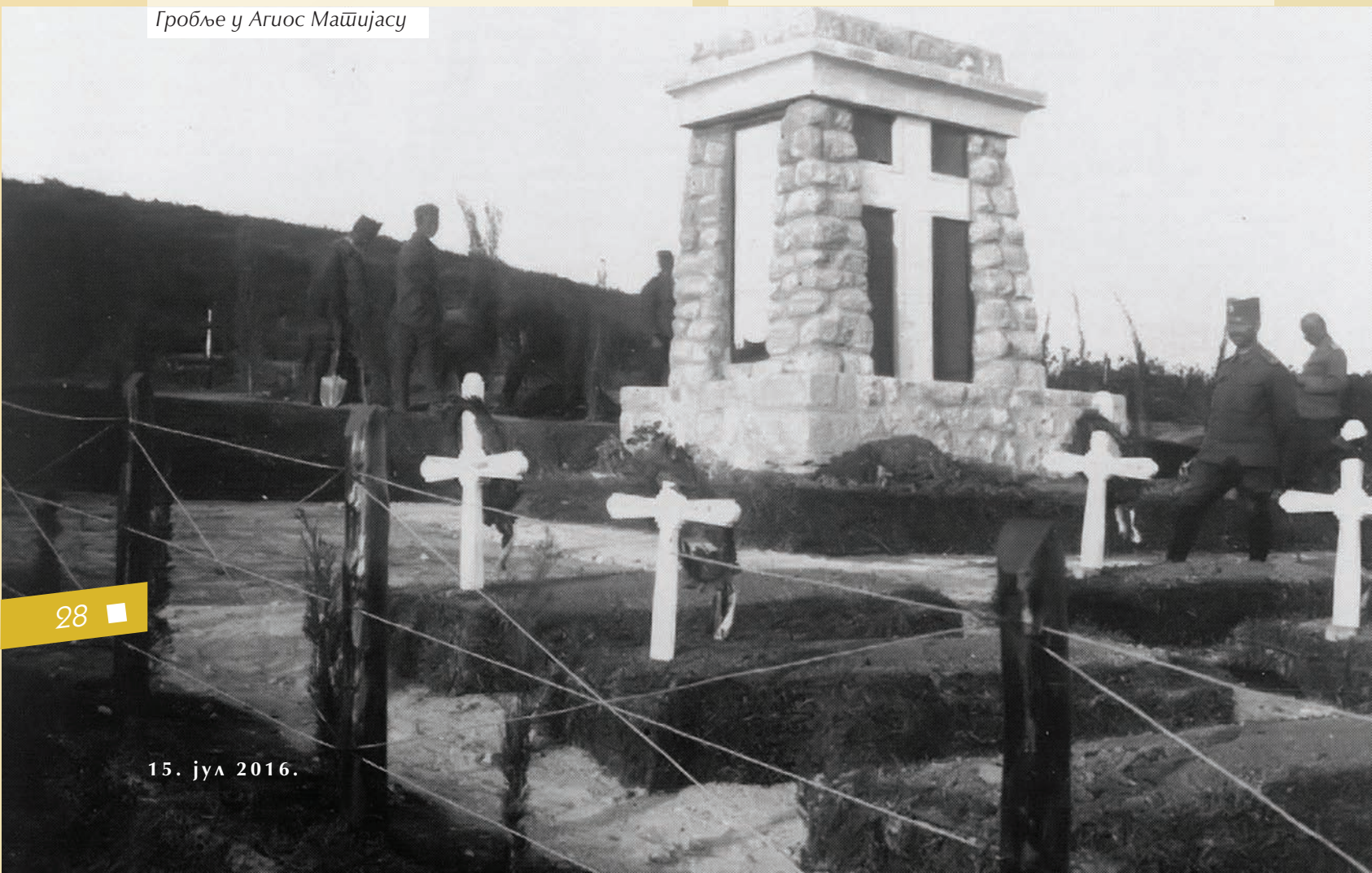
Гробље у Агиос Матијасу