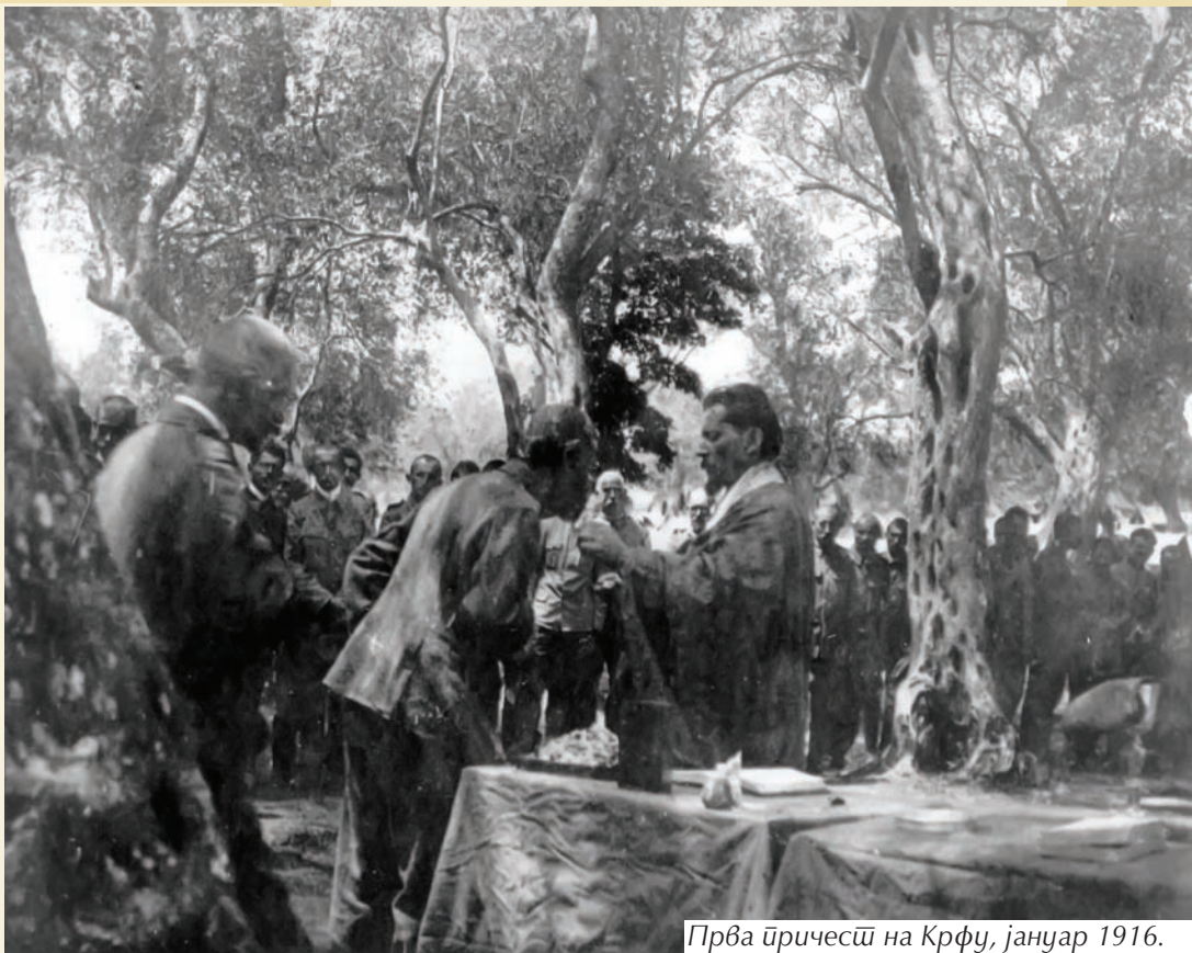
Прва причест на Крфу, јануар 1916.