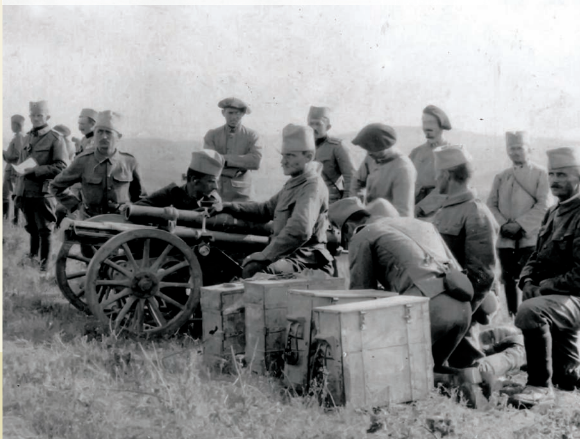
Обука у гађању из француских брдских топова 65 милиметара