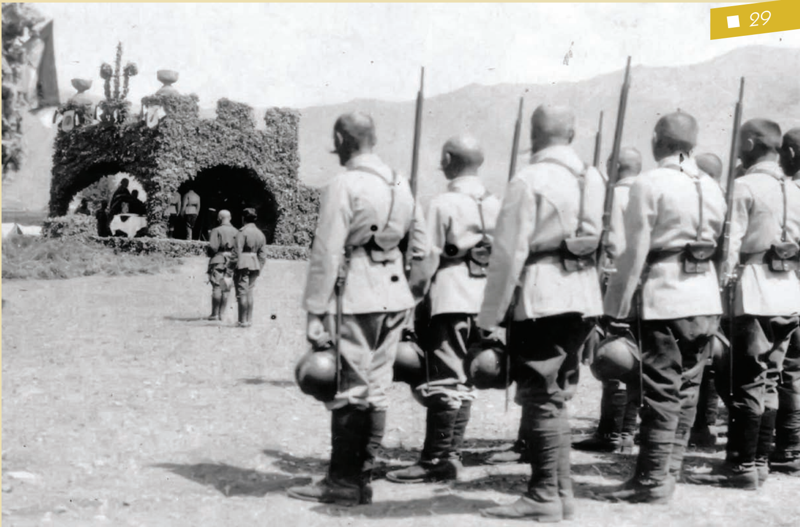
Пешидијски ђук „Гвоздени“ Моравске дивизије даје ђомен својим друговима ђошћољеним у „Плавој гробници“. Ијсос, 7. ајрил 1916.