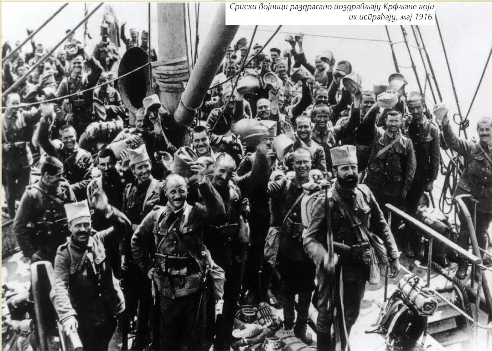
Српски војници раздрагано поздрављају Крфљане који их испраћају, мај 1916.

Након што је почело искрцавање колског материјала и коња на полуострво Халкидики, Врховна команда је 9. априла наредила транспорт одговарајућих јединица са Крфа на Халкидики. Најпре је из сваке дивизије требало транспортовати штаб профијантске колоне и по једно одељење дивизијске профијантске колоне. Транспорт првих јединица почео је 12. априла из пристаништа Говино, за јединице из састава Прве армије, односно, из пристаништа Мораитика, за јединице Друге и Треће армије. Те јединице имале су задатак да припреме логоре на Халкидикију и прихвате прве транспорте коња. Врховна команда је 13.