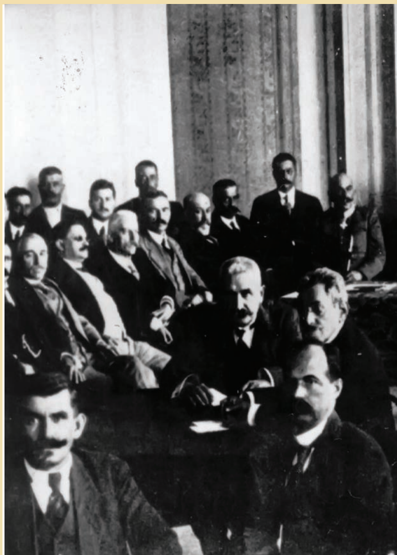
Седница српске Народне скупштинe и Владе, Крф, 25. фебруар 1917.

Српска влада боравила је у Бриндиизију од 15. до 18. јануара, чекајући полазак брода за Крф. Након доласка на Крф, 18. јануара 1916, главни задатак српске владе и даље је био организовање евакуације српске војске са албанских обала. У вези са неутралношћу Грчке и противљењу њене