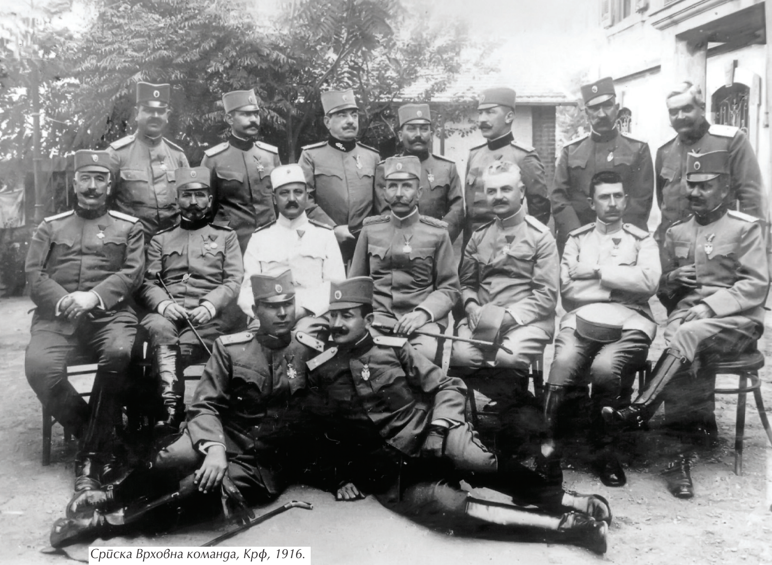
Српска Врховна команда, Крф, 1916.

жне за одржавање реда у граду Крфу и на важнијим раскрсницама. Инсистирало се на томе да сви српски официри и војници који долазе у град Крф имају дозволу за кретање. Начелник штаба Врховне команде генерал Петар Бојовић наредио је 14. фебруара 1916. да се предузму мере да војнике одмах при искрцавању дочекају представници из њихове команде и да се под командом одведу у логоре; да се уреде све јединице и да се поставе одговарајуће старешине које би биле одговорне за све што њихови војници учине; да се логори уреде према прописима ратне службе и да се поставе унутрашње јаке страже, да не дозвољавају излазак из логора без дозволе; да патроле непрестано крстаре у околини логора и на главним путевима и дању и ноћу; да се нареде смотре и прозивке војника два пута дневно; да се предузму све мере да се у свако доба о сваком старешини и војнику зна где је и шта ради; да се у граду Крфу организују патроле чији је задатак да војнике без дозволе за кретање спроведу команданту места на даљу надлежност.