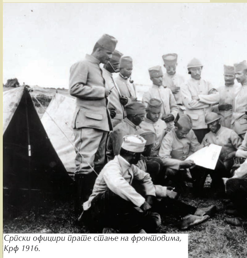
Српски официри прате сјање на фронтовима, Крф 1916.