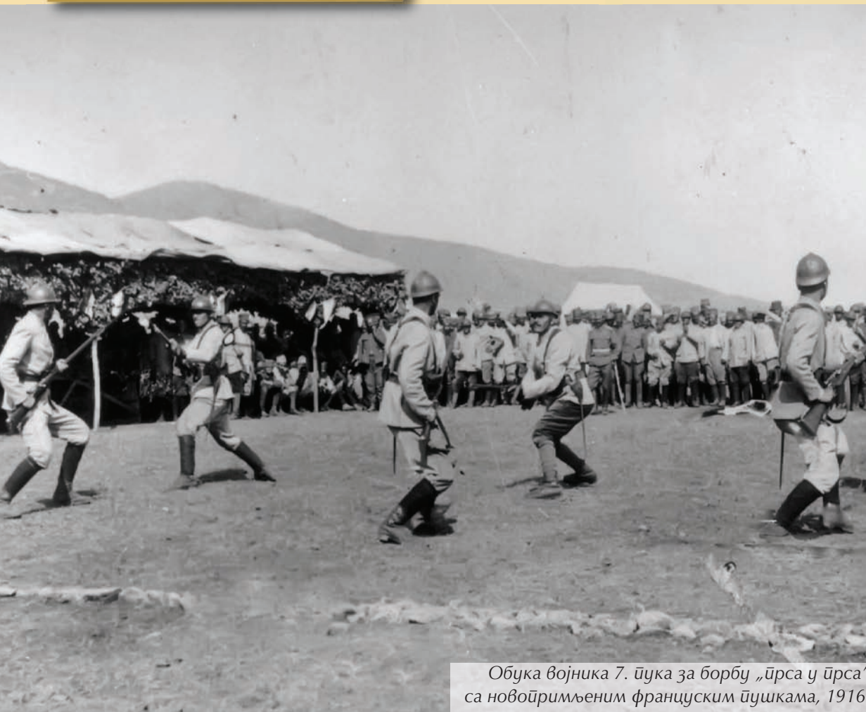
Обука војника 7. ђука за борбу „ђрса у ђрса“ са новђримљеним француским ђушкама, 1916.

ство граничне трупе, жандарми и све друге јединице ушли су у састав дивизија првог позива своје територије. Пешадијски пукови Комбиноване дивизије, 3. и 4. прекобројни пук ушли су у састав Вардарске дивизије. Од пукова трећег позива једне обласне дивизијске територије образован је један пешадијски пук и подређен команданту дивизије. Осим тога, Уђуђом за извођење нове формације предвиђено је да се од добровољаца из свих крајева формира Добровољачки одред који би Врховна команда придодала једној од дивизија. Формација је промењена у ходу, а не као што је било уобичајено: прво у теорији, затим у пракси. Због тога су се појавиле нејасноће и недостаци који су се могли сагледати само на лицу места. Врховна команда је закључила, и о томе обавестила министра, да с обзиром на околности у којима се војска налазила, било је извесно да ће њена формација подлегати честим променама у току реорганизације.